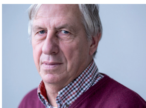
Evenementen Ruud Gerards