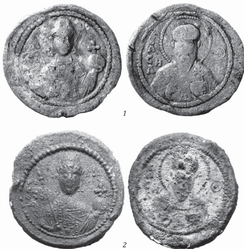
Рис. 1. Актовые печати Рогволода. ©2015 И.А. Жуков