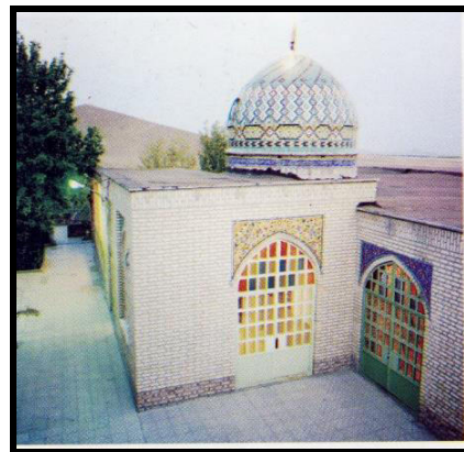
2-ci Şəkil. İmamzadə Əbəzərin gümbəzi.