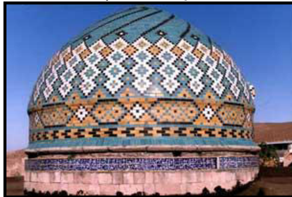
3-cü Şəkil. İmamzadə Əbəzərin uzaqdan görünüşü.

Açar sözlər: tarix, memarlıq, Qəzvin şəh., İmamzadə, məqbərə