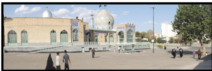
تصویر ۳ - امام زاده سید ابراهیم ، زنجان

ارتقاء سطح فرهنگی ، معنوی منطقه با احداث بناهایی با کارکرد مکمل در مجاورت آن به جهت برقراری ارتباط موثر با محیط پیرامونی