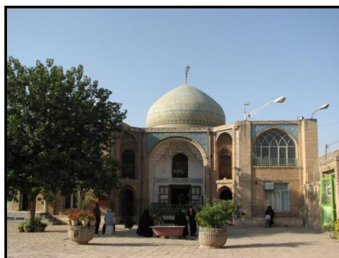
تصویر ۴ - امامزاده اسماعیل قزوین

حفظ هویت فرهنگی ، معنوی و اجتماعی منطقه به جهت حفظ و افزایش هویت کارکردی بنا