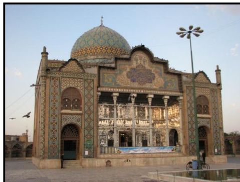
تصویر ۵ - شاهزاده حسین قزوین ارتقاء سطح هویت فرهنگی ، معنوی منطقه به سبب کالبد زیبا و حفظ هویت کارکردی بنا