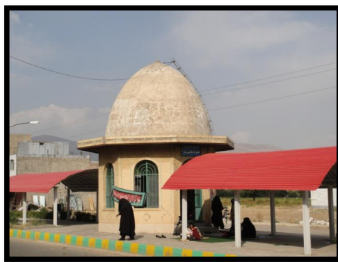
تصویر ۱ - امام زاده قاسم و سارا ، صائین قلعه زنجان

در بناهای تاریخی زیارتگاهی علاوه بر حفظ کالبد بنا باید به دنبال حفظ روح آن نیز بود ، زیرا این بناها ضمن دارا بودن ارزش معماری ، دارای ارزش اعتقادی و نوعی قداست می باشند ، که احترام به این بناها احترام به اعتقادات مذهبی است و بایستی این میراث را حفظ کرده و به فرزندانمان هدیه کنیم.