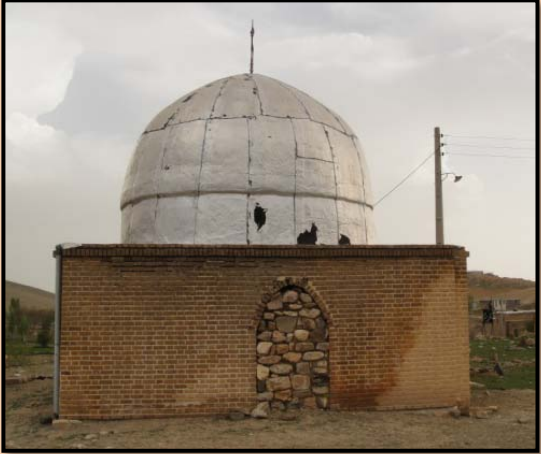
شکل۷- امامزاده احمد روستای چنگوری زنجان بعد از مرمت

و در ضلع غربی میدان شهدا در خیابان سلامگاه شهر قزوین بنای تاریخی شاهزاده حسین واقع شده که قدمت اولیه بنا را متعلق به قرن هشتم یا نهم دانسته اند و تا به امروز مرمتهای زیادی بر روی بنا انجام یافته است ولی هیچ کدام از آنها روح بنا و اصالت واقعی آن را مخدوش نکرده است و امروز هم این بنا از لحاظ سبک معماری و ویژگی های هنری دارای ارزش خاصی در بین بناهای تاریخی شهرقزوین می باشد. (شکل ۸)