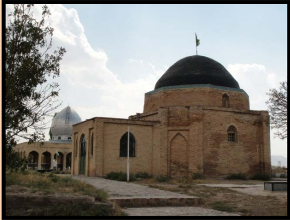
شکل۱- امامزاده ابراهیم شهر سلطانیه استان زنجان و دورتر از آن بنای مزار شهدا

در این خصوصی می توانیم با حفاظت تاریخی بنای مورد نظر و با رعایت حریم تاریخی ، بنای دیگری متناسب با نیاز های زمان خود و متناسب با بنای تاریخی احداث نماییم . چون این ساختمان ها نشانه های معماری زمان ما هستند در کنار معماری زمان های گذشته مفیوم می یابند و باید گفت این بناها نه تنها به هویت شهر و بناهای تاریخی خدشه ای وارد نمی کنند ، بلکه مردم ، تاریخ گذشته شهر را در زندگی روزمره خود احساس می کنند و این خود بر رونق و اعتبار بافت ها و بناهای تاریخی مو چندان تاثیر می گذارد. به عنوان مثال در استان زنجان در محل قبرستان قدیمی شهر سلطانیه و در فاصله ای از بقعه امام زاده ابراهیم که به استاد تزیینات سلجوقی گنبد آن ، ارزش تاریخی بنا حاضر اهمیت می باشد ، بنای یادبودی به عنوان مزار شهدا در محوطه این امامزاده ساخته شده است که نه تنها ارزشهای تاریخی و فرهنگی بنای امامزاده را مخدوش نکرده است بلکه تفریحی است از معماری دو دوره در کنار هم و بدین صورت با حفظ نمادها و نشانه های اسلامی شهر به حفظ هویت و اصالت بومی و فرهنگی منطقه و ایجاد سرزندگی در آن و با اثر گذاری بر سیما و شکل بنای احداثی جدید اهمیت حفظ این بناها را کاملاً مشهود می نماید.(شکل)