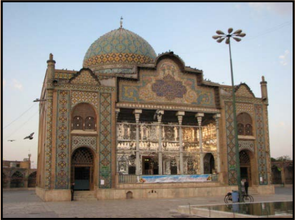
شکل۸- امامزاده حسین شهر قزوین

و در ضلع غربی میدان شهدا در خیابان سلامگاه شهر قزوین بنای تاریخی شاهزاده حسین واقع شده که قدمت اولیه بنا را متعلق به قرن هشتم یا نهم دانسته اند و تا به امروز مرمتهای زیادی بر روی بنا انجام یافته است ولی هیچ کدام از آنها روح بنا و اصالت واقعی آن را مخدوش نکرده است و امروز هم این بنا از لحاظ سبک معماری و ویژگی های هنری دارای ارزش خاصی در بین بناهای تاریخی شهرقزوین می باشد. (شکل ۸)