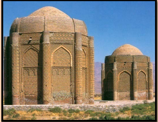
شکل۵- برجهای خرقان واقع در آوج پس از مرمت اولیه

و اما در روستای چنگوری زنجان بنای امامزاده ای موسوم به امامزاده احمد واقع است که گنبد آن را با مصالح نوین مرمت نموده اند علاوه بر ایراد مرمتی آن که با جسی رطوبت در بنا موجب فرایش بیشتر بنا را فراهم آورده است ، گنبد تاریخی و زیبای بنا با گریو آجرکاری و کاشیکاری زیبا و ساده اش هم اکنون تبدیل به یک روکش تفره ای (ایزوگام) شده است که نه اثری از زیبایی در آن بافت می شود نه اثری از هنر آجر کاری آن بر جای مانده است و نه اصالت و هویت تاریخی اش معلوم است. (شکل۶ تا ۷)