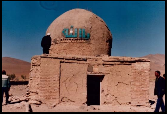
شکل۶- امامزاده احمد روستای چنگوری زنجان قبل از مرمت

و اما در روستای چنگوری زنجان بنای امامزاده ای موسوم به امامزاده احمد واقع است که گنبد آن را با مصالح نوین مرمت نموده اند علاوه بر ایراد مرمتی آن که با جسی رطوبت در بنا موجب فرایش بیشتر بنا را فراهم آورده است ، گنبد تاریخی و زیبای بنا با گریو آجرکاری و کاشیکاری زیبا و ساده اش هم اکنون تبدیل به یک روکش تفره ای (ایزوگام) شده است که نه اثری از زیبایی در آن بافت می شود نه اثری از هنر آجر کاری آن بر جای مانده است و نه اصالت و هویت تاریخی اش معلوم است. (شکل۶ تا ۷)