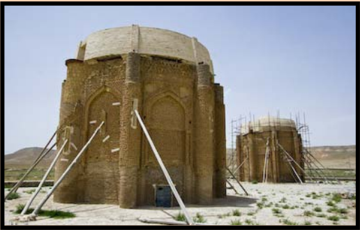
شکل۴- برجهای خرقان واقع در آوج در حال مرمت