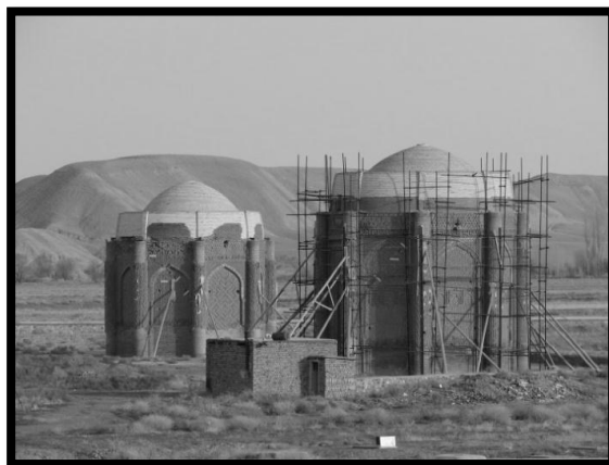
تصویر شماره ۲ - برجهای خرقان قزوین تخریب برجهای خرقان به علت زلزله آوج