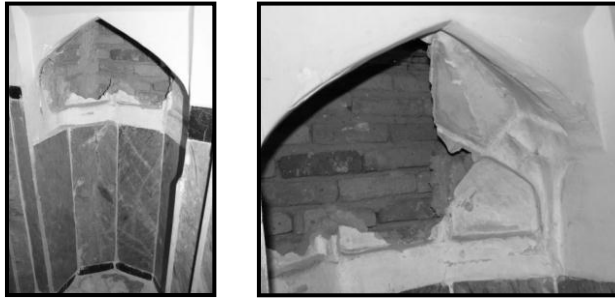
تصویر شماره ۳- قزوین امامزاده علی شکرناز تخریب محراب گنبد خانه جهت سود جوئی

یکی از آسیبهای انسانی به جهت سود جوئی انجام حفاری های غیر مجاز جهت گنج یابی در بناهای تاریخی است . بعضی جریان های انحرافی و ضد دینی - اعتقادی مردم با رواج شایعه در مورد پنهان بودن گنج در دیوار و یا زیر پی و ... باعث فریب مردم ساده لوح و یا منفعت طلب شده و آنان را تحریک و ترغیب به تخریب بنا می نمایند.