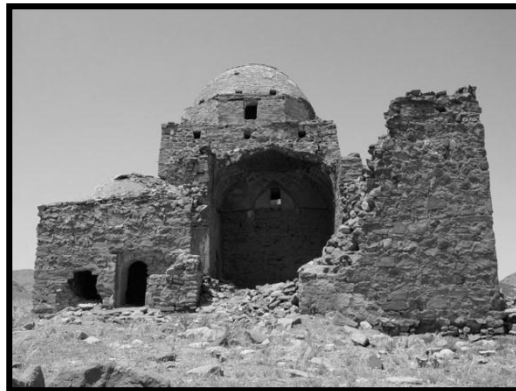
تصویر شماره ۱ - امامزاده قاسم قزوین تخریب به جهت فرسودگی مصالح بر اثر گذشت ایام و علل طبیعی مثل باد و باران